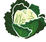
ببئركللا / فوفلملا